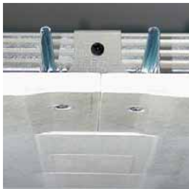
Fugenaufbau AK mit Knauf Fugenfüller Leicht und Papierfugendeckstreifen