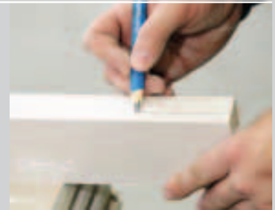
E Anzeichnen der oberen Ausklinkung