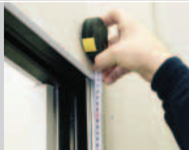
D Maß nehmen für die obere Ausklinkung