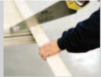
C Ablängen der seitlichen Laibungsblenden