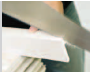
F Ausklinken der seitlichen Laibungsblenden – 4 Stk.