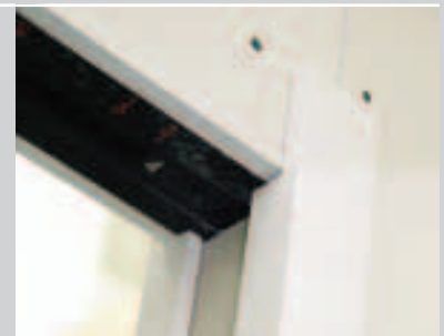
G Montage der seitlichen Laibungsblenden