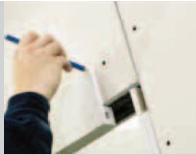
B Markieren der Höhe für das Ablängen der seitlichen Laibungsblenden