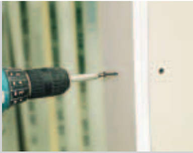
A Aufdoppelung 2 × 12,5 GKB auf CW-Profil bei Anschlagseite